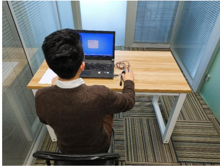
图二：电脑端背面视角