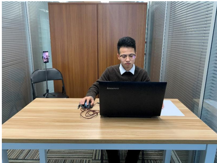
图一：电脑端正面视角

（3）考试开始前，考生需要先登录移动端“智考通”，用前置摄像头 360 度环绕拍摄考试环境，随后将移动设备固定在能够拍摄到考生桌面、考生电脑屏幕内容、周围环境及考生行为的位置上继续拍摄（详见说明书中《智考通操作手册》《智考云在线考试规范》）。