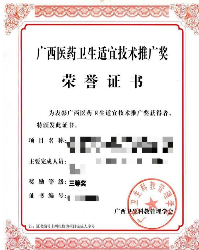
科技成果奖励证书（省部级以上）样式